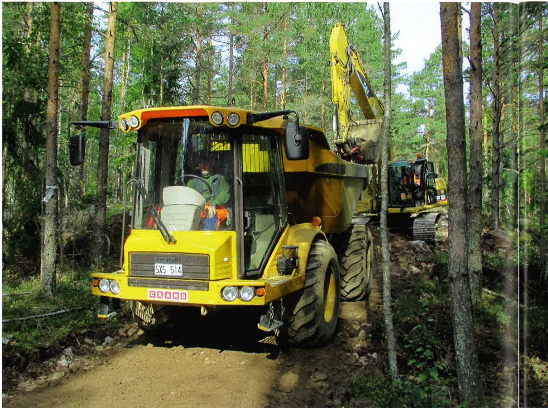
Markarbetet för Kristinehamns nya spår för precisionsorientering är nu inne i slutfasen. Under våren ska det nya spåret vara klart.